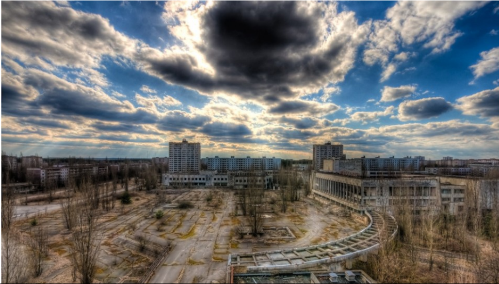
Tsjernobyl na de ramp in 1986.