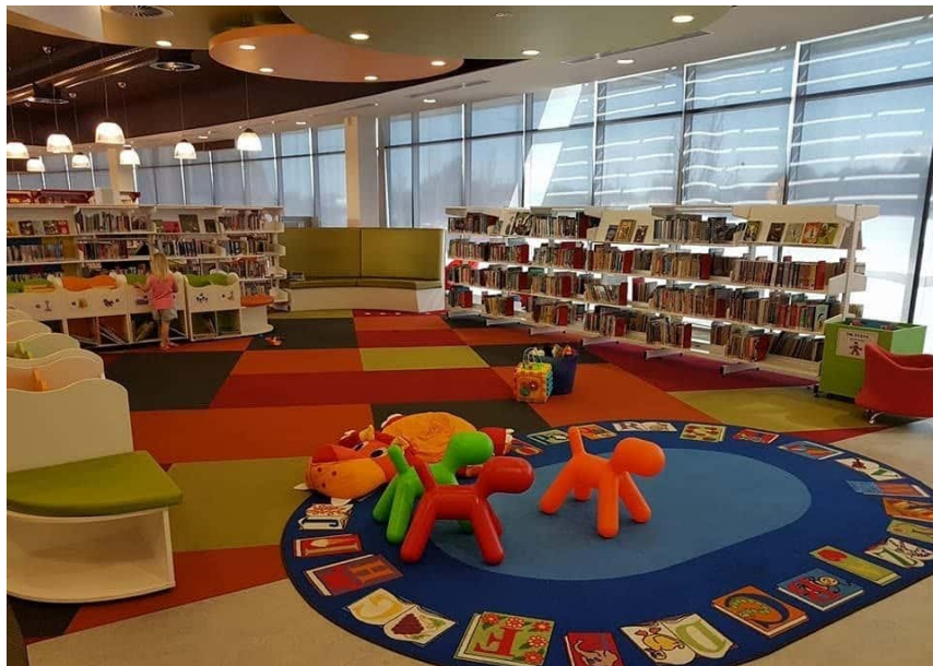
Een nieuwe bibliotheek in de basisschool in Cannington.