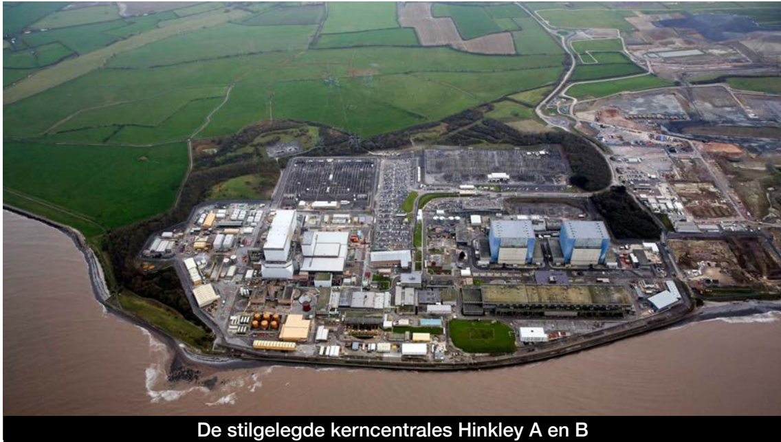
De stilgelegde kerncentrales Hinkley A en B