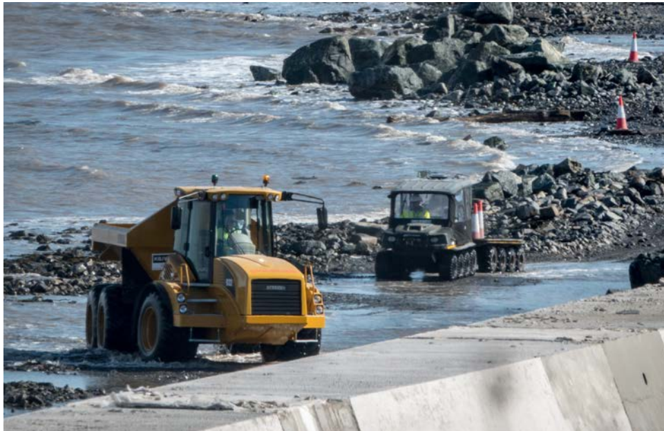
De bouw van de zeewering bij Hinkley.