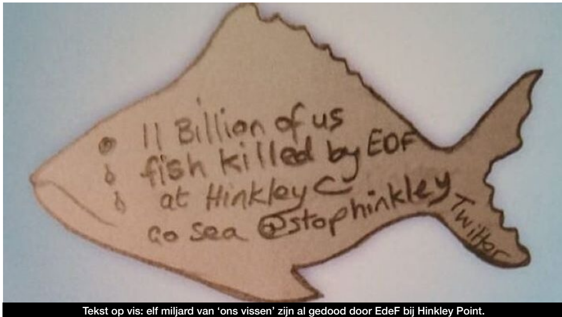
Tekst op vis: elf miljard van 'ons vissen' zijn al gedood door EdeF bij Hinkley Point.