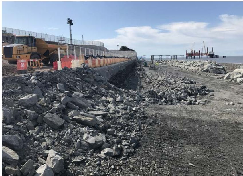
Is dit de toekomst van de Kaloot?